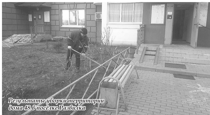
Результаты уборки территории дома 48 в посёлке Развилка