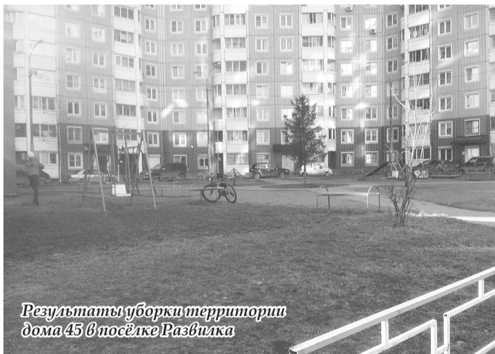
Результаты уборки территории дома 45 в посёлке Развилка

В середине марта Министерство жилищно-коммунального хозяйства Московской области в целях формирования комфортной городской среды и подготовки к летнему периоду объявило о начале месячника благоустройства, в рамках которого на территории региона будет проведено два областных субботника.